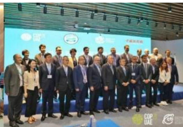
中外知名企业家可持续发展对话会