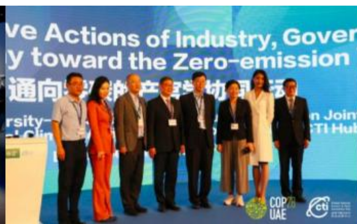
“通向零碳的产官学协同行动”边会