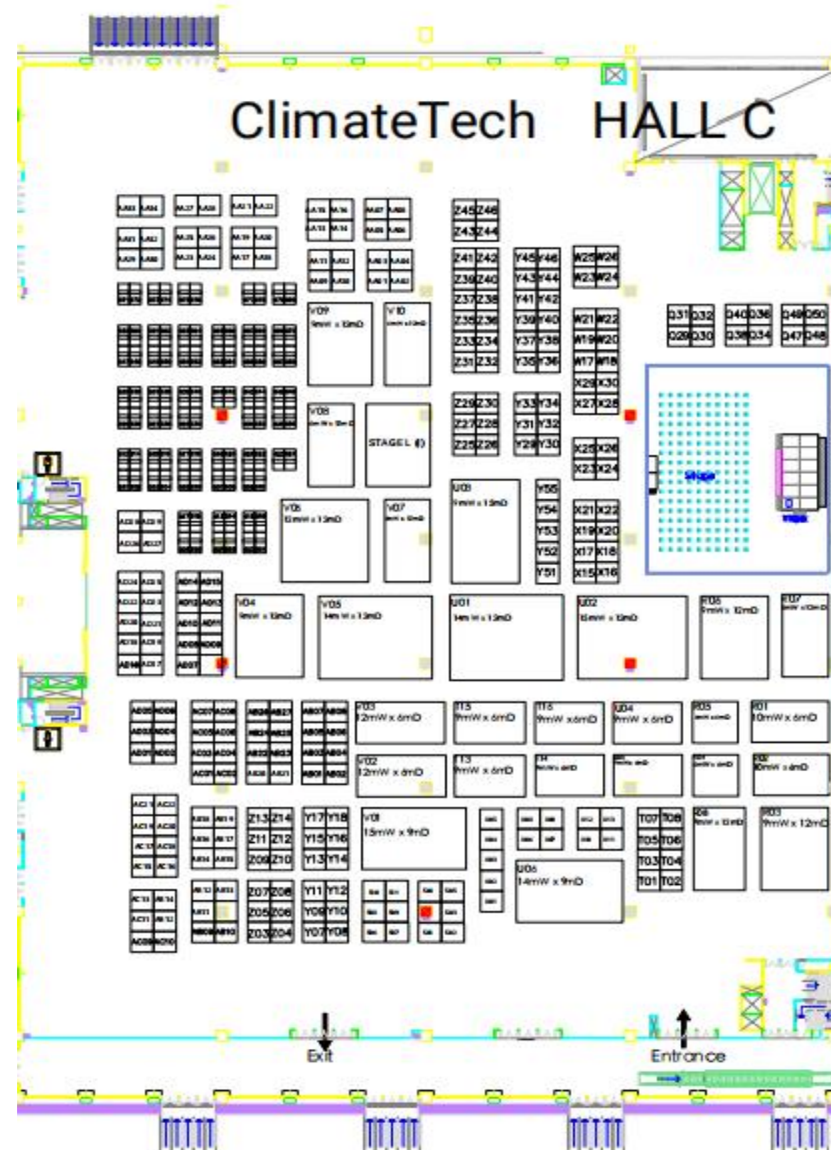
气候科技展区展位示意图