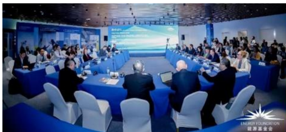
能源基金会COP28系列活动