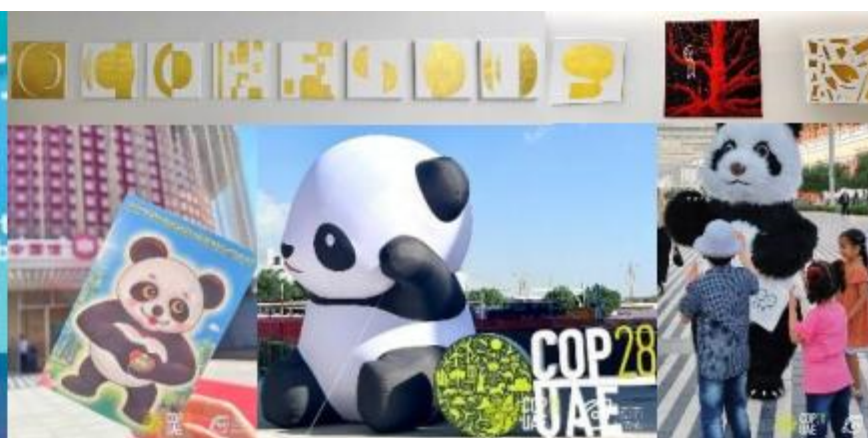
青年艺术展览 + “顶流”大熊猫