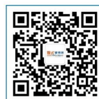
雅式橡塑网服务号